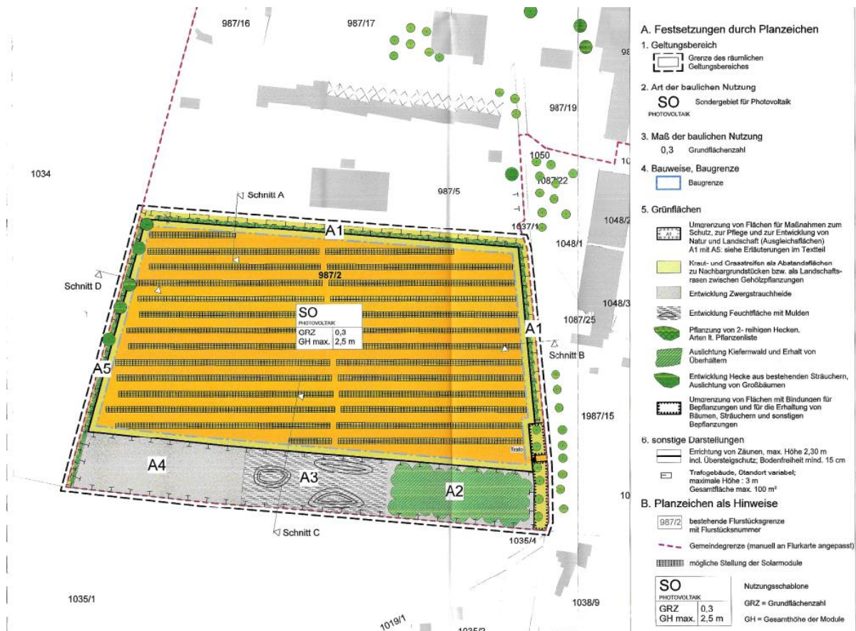
Abbildung 1: Ausschnitt aus dem rechtsverbindlichen Vorhabenbezogenen Bebauungsplan „Sondergebiet (SO) Photovoltaik Sulzmühl“